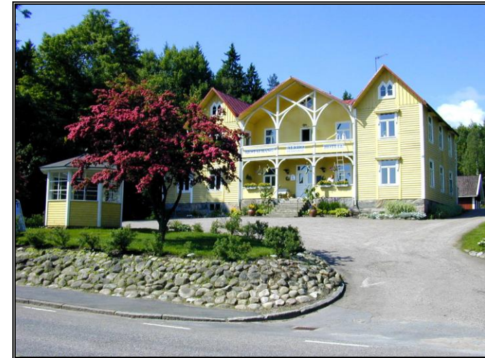
Hotel & restaurant Unnaryd, Halland, Sverige www.alebo.se