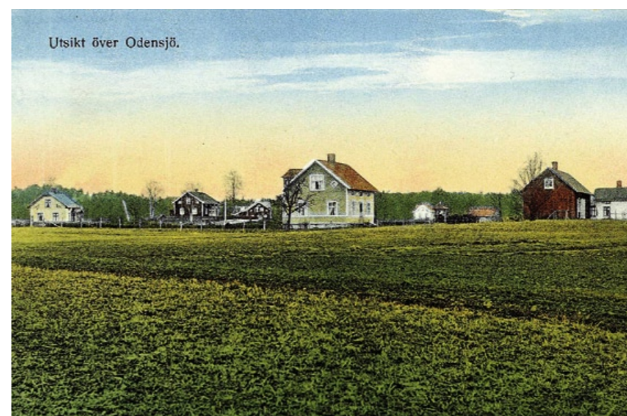
Vy över Odensjö.

kunde de samtidigt med posten forsla gods. Skolbarnen använde vid denna tid inte cykel. Ofta fanns det bara en cykel per familj. Många köpte sin första cykel efter konfirmationen då de börjat tjäna egna pengar. En cykel på 1930-talet kostade ungefär 100 kronor. Det var inte så lite för den som kanske hade en kontant månadslön på 40 kronor utöver mat och husrum.