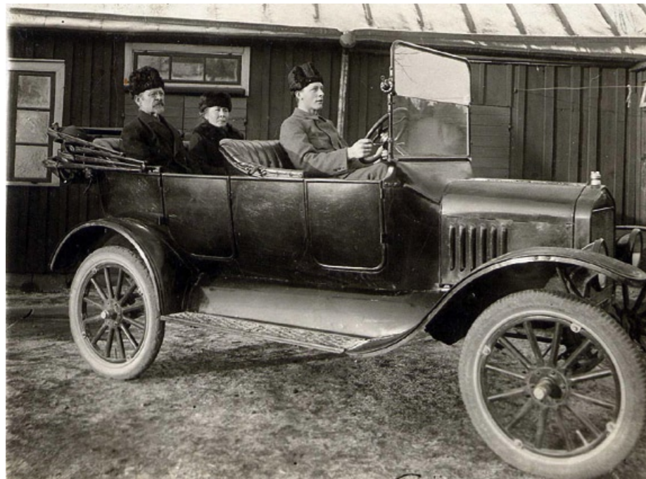
Arndts taxibil år 1923 med registreringsnummer G500.