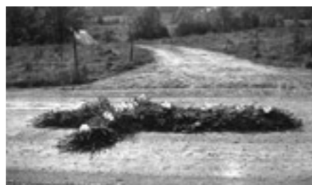
Vägsmyckning vid begravning.

genom sorgebrev med svarta kanter. I kyrkan ringde klockorna klockan tio på morgonen efter dödsfallet. Detta sker än idag. Storklockan används om det är en man som avlidit men lillklockan om det är en kvinna. På klockklangen går det alltså att avgöra den avlidnes kön. På begravningsdagen infann sig gästerna redan klockan sju i sorgehuset. Då bjöds på frukost och kaffe. Den avlidne skulle ”läsas ut”. En särskilt vackert prydd likvagn drogs av häst. Längre tillbaka var det bara de välbeställda som gjorde sin sista färd i likvagn. Ofta bars i stället liket till kyrkan. Efter gick hela begravningsföljet. I alla vägkorsningar eller gård de passerade låg vackert utlagda kors av granris. På så vis hedrades den avlidne. Denna sed finns i viss utsträckning fortfarande kvar.