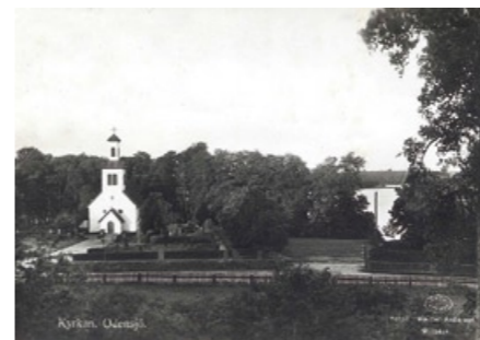
Odensjö kyrka omkring 1900.

och våren. Hela vägen var ibland som ett gungfly. Det berättas att många föräldrar fick lov att följa sina barn till skolan. Ibland fick de rent av bära dem över det värsta. De kringboende hade skyldighet att underhålla var sin bit av vägen. Resultatet blev emellertid beroende på var och ens godtycke. På vägstämmorna kunde det gå ganska stormigt till. Det naturliga färdssättet var helt enkelt att gå. Hästen användes mest i arbetet eller om det var något utöver det vanliga som hände. Postskjutsarna hade häst och flakvagn. Då