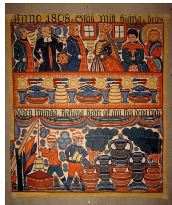
Ned till: Vatten blir vin.